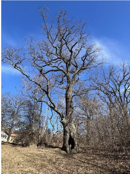
Figur 1. I Nockebyhov finns flera gamla grova ekar (SBK)

I gällande stadsplaner från 1939, 1945, 1959 är biotopskydds-området reglerat som Park eller allmän plats, planterad, då begreppet Natur inte användes före plan- och bygglagens tillkomst 1987.